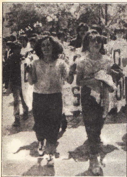
MOVILIZACION AMPLIA Y POPULAR QUE PROYECTE LA ACTIVIDAD DEMOCRATICA AL SOCIALISMO

masas intervengan, abonando un escenario donde sus conflictos no pasan a mayores y donde las masas asisten como espectadores o, a lo más, como simple masa de maniobra de una u otra fracción burguesa.